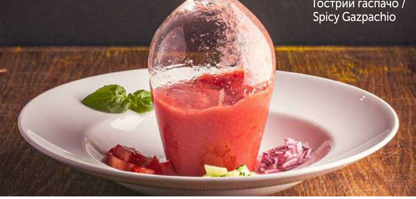
Гострий гаспачо / Spicy Gazpachio