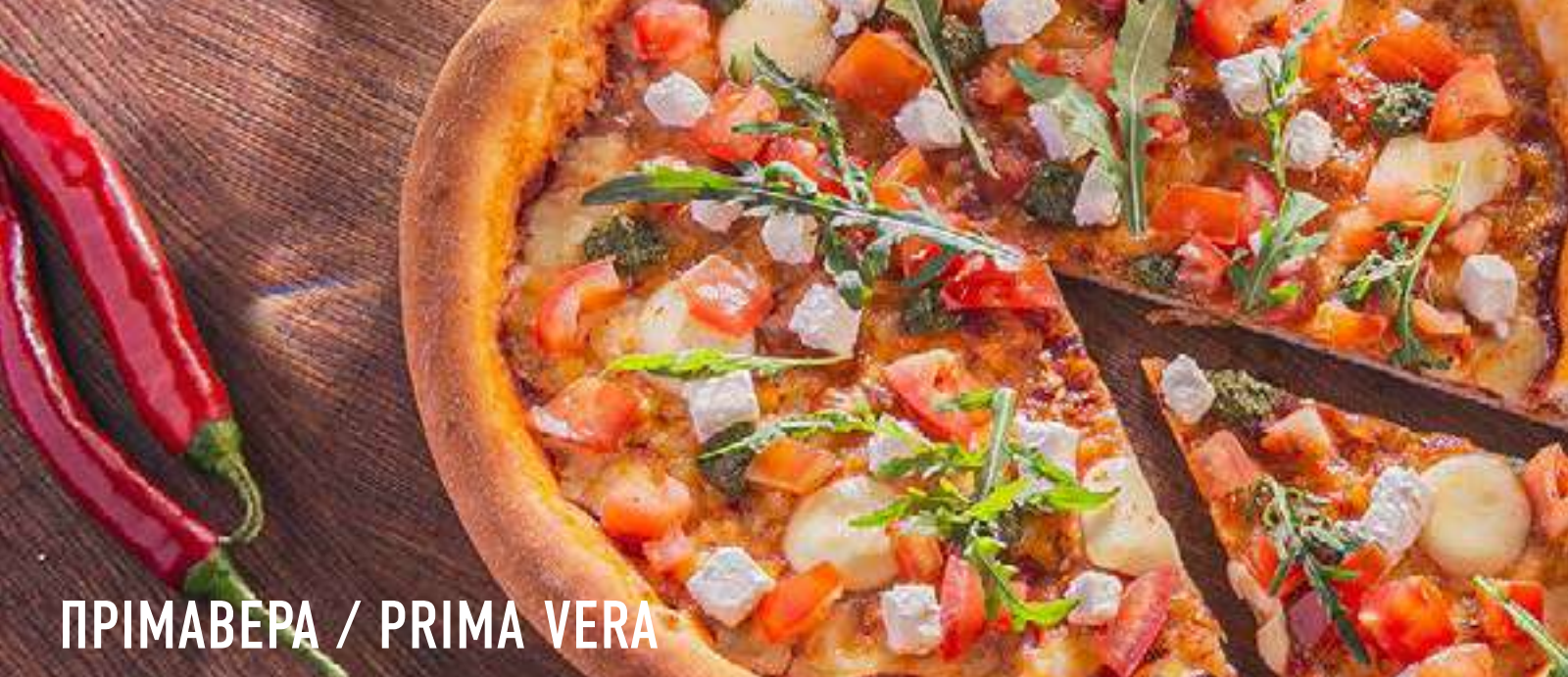
ПРИМАВЕРА / PRIMA VERA