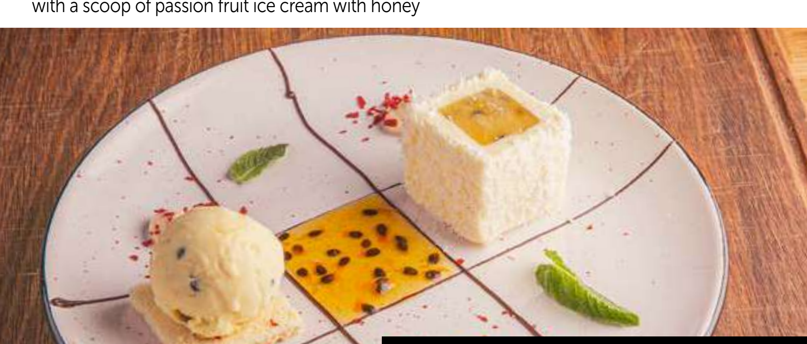
Мусовий чізкейк з маракуєю / Mousse cheesecake with passion fruit

Бісквіт савоярді, маракуєве конфі, сирний мус. Подається з кулькою морозива Маракуя з медом. / Biscuits Savoirdi, passion fruit confit, cheese mousse. Served with a scoop of passion fruit ice cream with honey