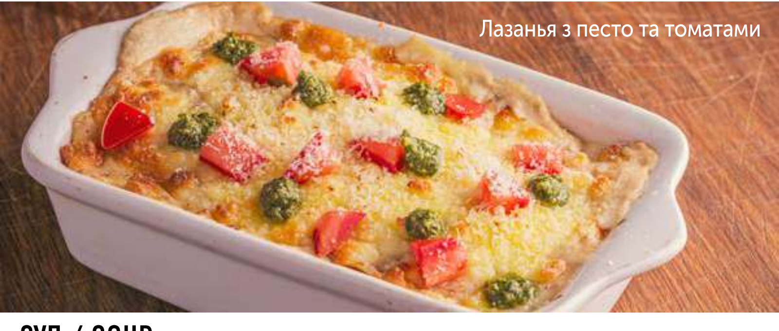
Лазанья з песто та томатами